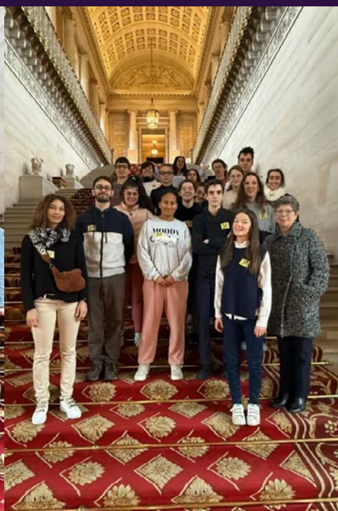
7 février visite du groupe d'élèves du Lycée Don Bosco, Lyon 5eme