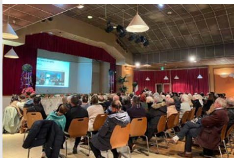
17 janvier - Brindas