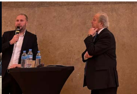
10 mars Assemblée Générale d'AMACOR ADAMA69 à Villefranche-sur-Saône