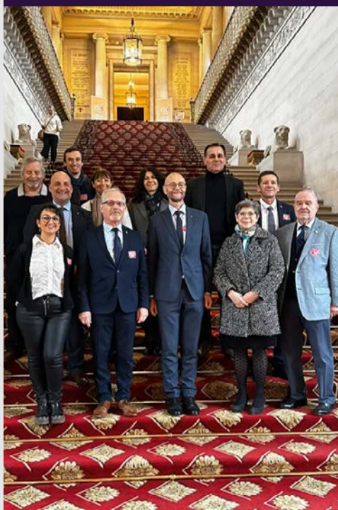
22 janvier Groupe d'élus de Meyzieu