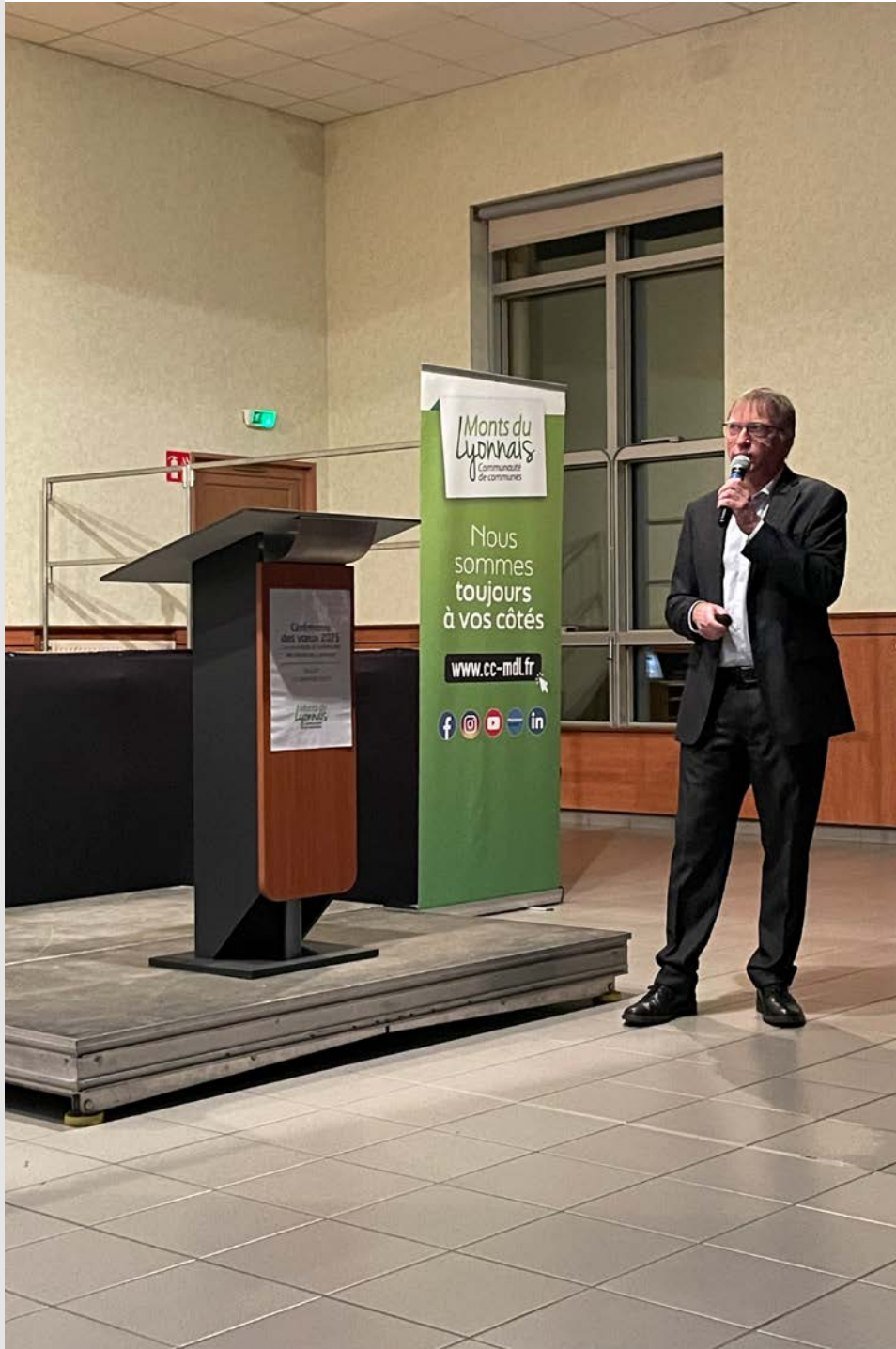
17 janvier Vœux de la Communauté de communes des Monts du Lyonnais à Souzy