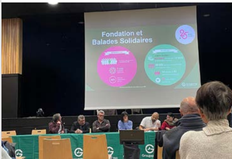
7 mars Assemblée Générale de la caisse locale de Groupama à Messimy