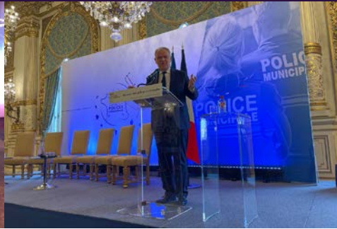
21 février Lancement du « Beauvau de la Police Municipale » par le ministre François-Noël Buffet