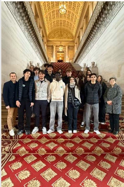
11 février Groupe d'élèves du Lycée Ella Fitzgerald Saint Romain en Gal