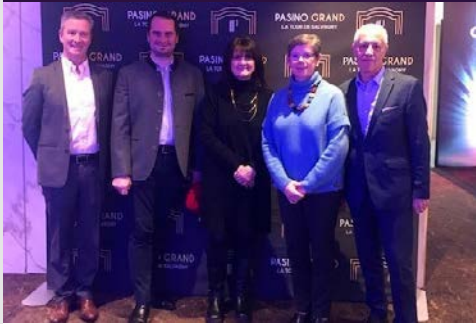
10 février Visite du Pasino Grand de La Tour de Salvagny