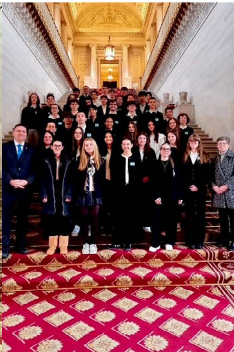
20 février Groupe d'élève de la classe Défense du Lycée Assomption Bellevue – La Mulatière