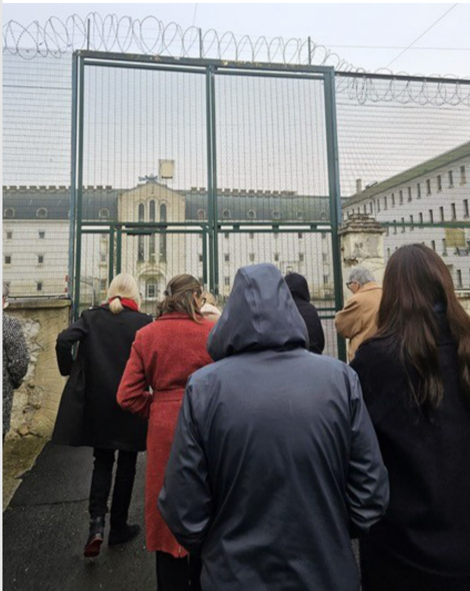
Déplacement au centre pénitentiaire de Caen le 31 janvier et au centre pénitentiaire de Fresnes le 6 février.