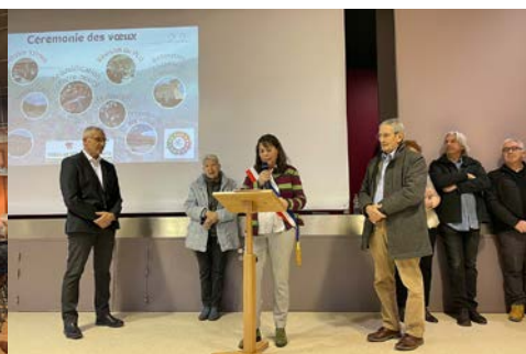
19 janvier - Yzeron